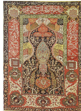
تصویر ۴: قالیچه سجاده‌ای، شمال غرب ایران اوایل سده یازدهم هجری، قبلاً متعلق به دولت ترکیه (اکنون در موزه تویقاپی) (پوپ، ۱۲، ۱۳۸۷/۱۱۶۹)

و از نقوش حیوانات و پرندگان استفاده نشده است.