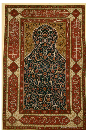
تصویر ۹: قالیچه سجاده‌ای قرن ۱۶ و ۱۷ میلادی سایز ۱۶۴×۱۰۲ سانتی‌متر

شده است (وندشعاری، ۱۳۹۲: ۱۲۵). این نمونه تمام زمینه لاکی زیر محراب با بند ختایی و گل شاه عباسی پر شده است و دارای اسلیمی ماری با رنگ سفید درون فرش می‌توان دید و در حاشیه بزرگ در ادامه کتیبه ۴ گوش اسلیمی‌های دهن اژدری و ختایی و در ادامه حاشیه‌های کوچک بند ختایی آورده شده است.