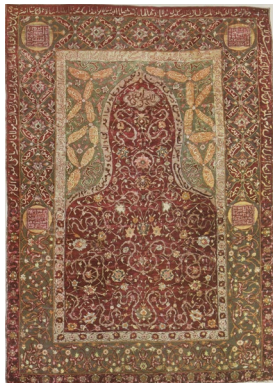
تصویر ۵: قالیچه سجاده‌ای غنی شده با گلابتون، شمال غرب ایران / اواخر سده دهم هجری. در تملک برادران بکری ۱۶۰×۱۱۰ سانتی متر (پوپ، ۱۲، ۱۳۸۷/۱۱۶۶)

دُرِّیَّتِی رَبَّنَا وَتَقَبَّلْ دُعَاءَ رَبَّنَا اغْفِرْ لِي وَلِوَالِدَيَّ وَلِلْمُؤْمِنِينَ يَوْمَ يَقُومُ الْحِسَابُ» و در لچکی محراب شاهد نوشته‌های ناخوانا که اگر بخواهیم مانند قالی‌های دیگر در نظر بگیریم از القاب خداوند استفاده شده است.