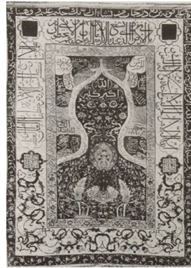
تصویر ۶: قالیچه سجاده‌ای شمال غرب ایران اوایل سده یازدهم هجری قبلا متعلق به دولت ترکیه اکنون در موزه توپقاپی (پوپ، ۱۲، ۱۳۸۷/۱۶۹)