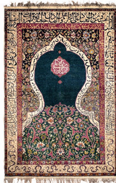
تصویر ۲: قالیچه محرابی تبریز سده هفدهم/ یازدهم موزه فرش ایران ۱/۴۵×۱/۲ سانتی متر (hali.com)

إِلَى الظُّلُمَاتِ أُولَئِكَ أَصْحَابُ النَّارِ هُمْ فِيهَا خَالِدُونَ» در نوار دور محراب نیز سوره (ابراهیم: ۴۰ و ۴۱) «رَبِّ اجْعَلْنِي مُقِيمَ الصَّلَاةِ وَمِنْ ذُرِّيَّتِي رَبَّنَا وَتَقَبَّلْ دُعَاءِ رَبَّنَا اغْفِرْ لِي وَلِوَالِدَيَّ وَلِلْمُؤْمِنِينَ يَوْمَ يَقُومُ الْحِسَابُ» نوشته شده است (تنهایی، ۱۳۸۸: ۱۳). و در زیر محراب کتیبه‌ای با چنین کلماتی (محمد(ص) و علی(ع) و الله) آورده شده است.