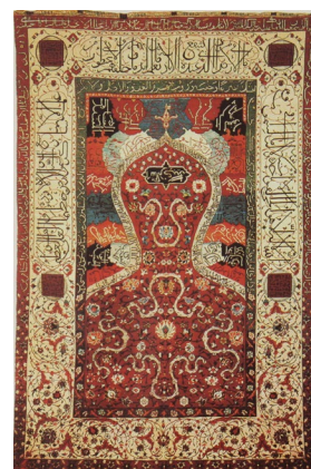
تصویر ۸: قالیچه سجاده‌ای غنی شده با گلابتون شمال غرب ایران اواخر سده دهم هجری موزه متروپولیتن (قبلا مجموعه ایزاک فلچر) ۱۶۷×۱۶۱ سانتی‌متر (پوپ، ۱۳۷۸، ۱۲، ۱۱۶۷)