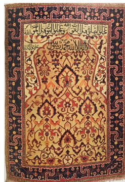
تصویر ۷: قالیچه جانمازی حومه اصفهان از مجموعه فرش ایران (بی‌نام، ۵۰، ۱۳۶۱)

این فرش از نظر طرح و نقش با دیگر فرش‌های سجاده‌ای این دوره کمی متفاوت است. از خطوط شکسته به جای گردان استفاده شده است. در زیر محراب واگیرهای با بند ختایی شکسته طراحی و همان تکرار شده است. در زیر محراب شهادتین «لا اله الا الله محمد رسوا الله» و «علی ولی الله» در قسمت چپ لچک محراب آمده است و در لچک محراب استفاده از اسلیمی‌های شکسته و نوشته «عجلو بالصلاه قبل الفوت الله اکبرو عجلو بالتوبه قبل الموت الله اکبر» آمده است. «نوشته این جانمازی مانند جانمازی بالا، قبل از مرگ، انسان‌ها را به نماز و توبه دعوت می‌نماید: عجله کن به نماز قبل از اینکه وقت آن بگذرد و عجله کن به توبه قبل از اینکه مرگ فرا رسد.» (وندشعاری، ۱۳۹۲: ۱۲۶). این فرش تنها یک حاشیه بزرگ دارد که با بند شکسته اسلیمی پر شده است و به صورت واگیرهای سرتاسر حاشیه را پوشش می‌دهد. این فرش مانند دیگر فرش‌ها سجاده‌ای هیچ‌گونه حیوان در آن نیست.