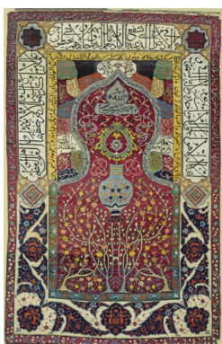
تصویر ۱۰: فرش سجاده‌ای درختی دوره صفویه

وَلَا تَكُنْ مِنَ الْغَافِلِينَ إِنَّ الَّذِينَ عِنْدَ رَبِّكَ لَا يَسْتَكْبِرُونَ عَنْ عِبَادَتِهِ وَيُسَبِّحُونَهُ وَلَهُ يَسْجُدُونَ» آورده‌اند و در نیمه‌ی فوقانی حاشیه شاهد اسلیمی هستیم و دور محراب متنی ناخوانا آمده است.