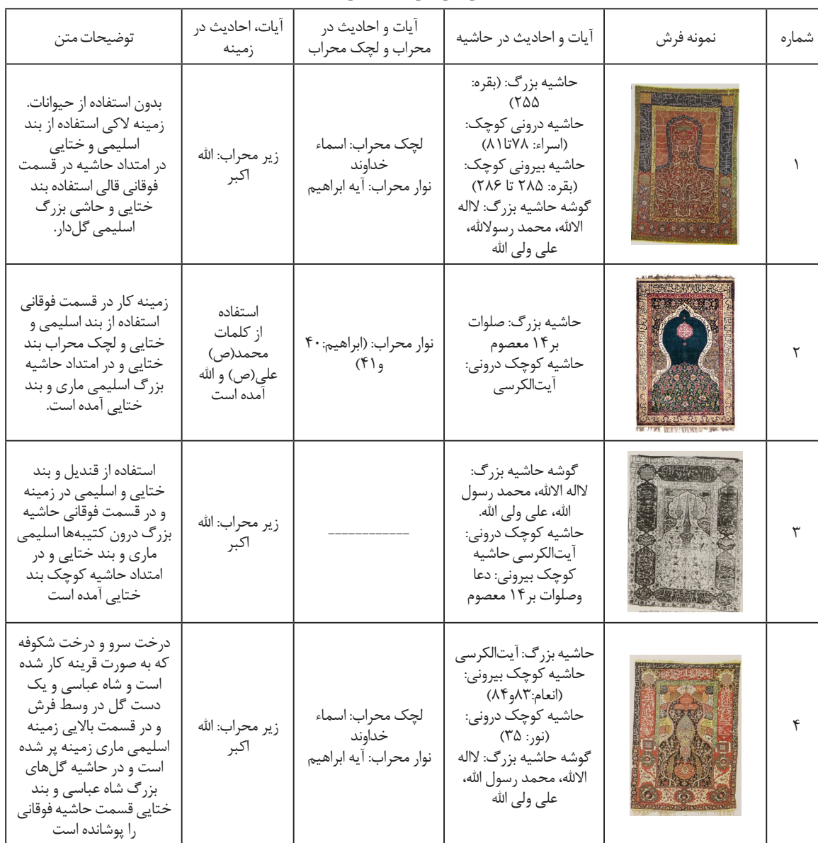
جدول ۱: ویژگی کلی قالی‌های محرابی دوره صفویه