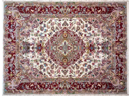
تصویر ۲- فرش معاصر بافت مشهد به تقلید از طرح‌های فرش تبریز، ۲/۵ در ۳/۵ متر، ۴۰ رج، بازار فرش مشهد (نگارندگان: ۱۴۰۰)

– خلأ مدیریتی و ساختاری: در زمینه پدیده مهمی چون فرش به عنوان کالای صادراتی و مصرفی که نقش مهمی در اقتصاد خانوارهای روستایی و شهری دارد، وجود نظام مدیریتی کارآمد و به‌روز، بسیار ضروری است. به گفته متخصصان خلأ مدیریت کارآمد در عرصه فرش یکی از عواملی است که به طور غیرمستقیم، اما مؤثر بر نزول کیفی طراحی فرش تأثیر گذاشته است. نخستین نتیجه خلأ مدیریتی، عدم حمایت بخش دولتی و بی‌توجهی به فرش است. یکی از این حمایت‌ها می‌تواند تأسیس اتاق ارزیابی فنی و کیفی فرش مشهد باشد که در سایه بی‌توجهی دولت انجام نشده است (کد ۱۰). همچنین تدوین بانک اطلاعاتی طراحان فرش و به طور خاص فرش مشهد، می‌تواند عامل مؤثری در ایجاد فضای رقابتی و هنری در عرصه طراحی باشد (کد ۱۰).